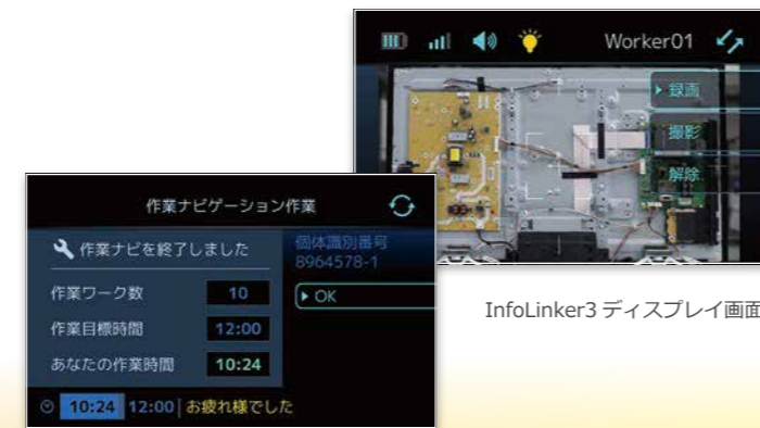
InfoLinker3 ディスプレイ画面